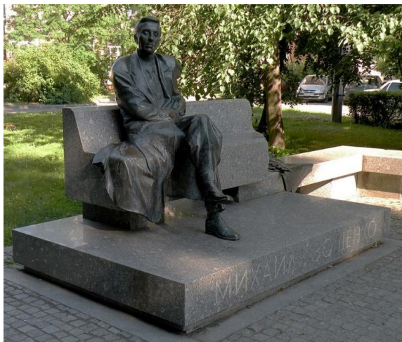
памятник М. М. Зощенко в Санкт — Петербурге

Ироничные произведения Михаила Зощенко полны едкой сатиры и посвящены злободневным темам его времени. В его книгах тонкие и меткие насмешки над пороками общества и отдельных индивидов умело смешаны с неподдельной грустью по поводу всего происходящего, и они действительно заставляют задуматься. Можно с уверенностью сказать, что Зощенко своими трудами помог многим людям измениться к лучшему.