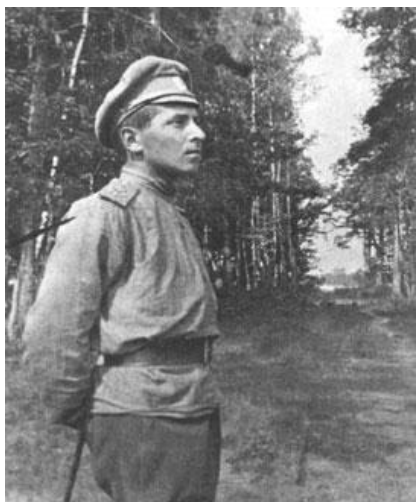
Зощенко на фронте.

После Февральской революции Михаил Михайлович кем только не работал - начальником почт и телеграфов, комендантом почтамта Петрограда, адъютантом Архангельской дружины, при советской власти – секретарём суда, инструктором по кролиководству и куроводству в Смоленской губернии.