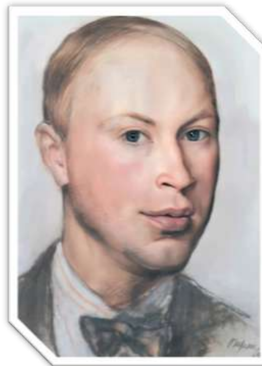
Сергей Сергеевич Прокофьев, 1926. Портрет работы Зинаиды Серебряковой.

Сонату (1949) и Симфонию-концерт для виолончели с оркестром (1952). Конец 40-начало 50-х гг. были омрачены шумными кампаниями против «антинародного формалистического» направления в советском искусстве, гонениями на многих лучших его представителей. Одним из главных формалистов в музыке оказался Прокофьев. Публичное шельмование его музыки в 1948 г. еще более ухудшило состояние здоровья композитора.