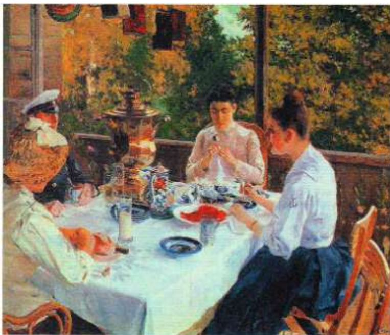
К. А. Коровин. За чайным столом. 1888 год. Государственный мемориальный историко-художественный и природный музей-заповедник В. Д. Поленова.

Читатели помнят, конечно, как Ермолай Лопухин в пьесе «Вишнёвый сад» предлагает Раневской единственно рациональный, как ему представляется, шаг по спасению старинной усадьбы - «вишнёвый сад и землю по реке разбить на участки и отдавать потом в аренду под дачи». И в итоге иметь «самое малое двадцать пять тысяч дохода». Разумеется, Любовь Андреевна Раневская, Гаев, Варя и Аня никогда не согласятся торговать священным для них пространством, где всё дышит прошлым, всё родное - и детская, и беседка, и каждое деревцо, и даже «многоуважаемый шкаф». Сама мысль о том, что какие-то чужие люди будут являться сюда, суетиться, селиться на лето, бесцеремонно ходить, нарушать границы, - невозможна для Раневской и людей её семейного круга.