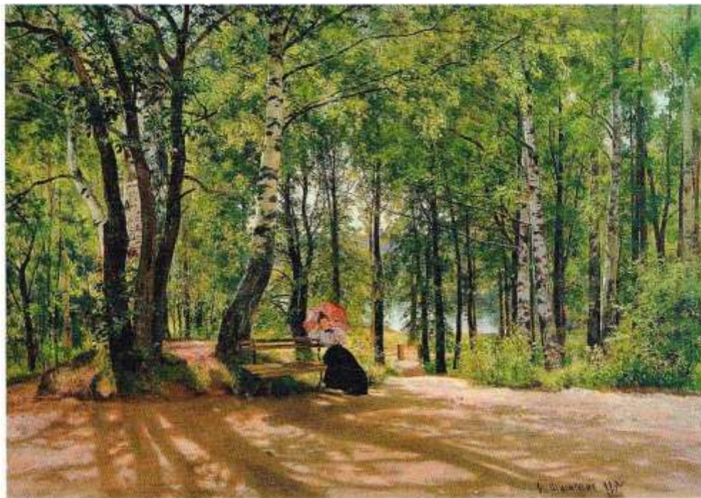
И. И. Шишкин. Около дачи. (На даче.) 1894 год. Государственный музей изобразительных искусств республики Татарстан.

Их мебель уносят, как отслуживший своё театральный реквизит. Это не дача пустеет и не сцена, на которой расцветала летняя поэма любви, отчуждается от зрителей. Это на душе главного героя становится пусто и неприятно. Дача - нечто прекрасное, цветущее. И... непостоянное. Ещё вчера, «в жаркий полдень», как символично пишет Гончаров, были и прогулки с Ольгой, и читались книги, и строились планы, и всё казалось выполнимым. А сегодня «пошли дожди» и густонаселённое соляренное пространство дачи опустело, потеряло световую ауру. Такова природа дачного пространства-времени, такова философия дачной жизни.