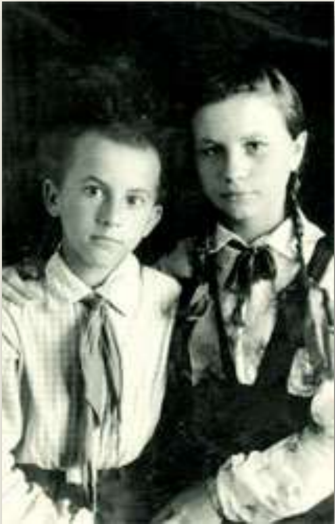
Со старшей сестрой

И вот в станицу нагрянула комиссия с проверкой. Проверка пришла домой к мальчику, чем очень напугала маму, а потом отправилась в школу и отчитала директора за недостаточное внимание к творческому развитию учеников. Как оказалось, композитор очень хотел и надеялся, что его заберут с собой и всему научат, но на деле проверяющие сказали, что ему необходимо немного подрасти и только потом приезжать учиться музыке.