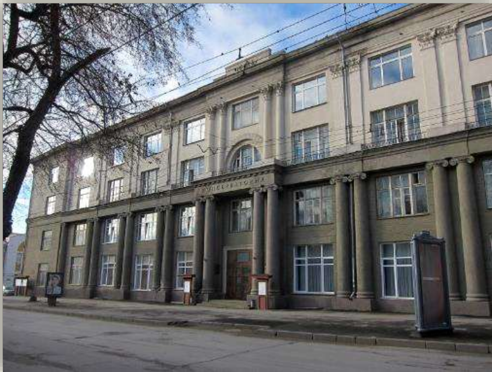
Новосибирская государственная консерватория им.Михаила Глинки