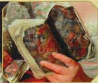
Жак Луи Давид. Портрет гусиной. Барок. 1769 год.