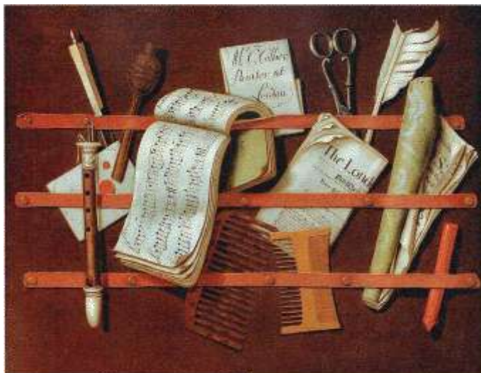
Джонатан Коллер. Натюрморт-обманка. Около 1890 года.

Изначально мраморная бумага шла на изготовление обложек тонких книжек типа брошюр. В XVII веке целиком «в мраморе» часто издавали сочинения малого объёма: альманахи, тонкие научные сборники, выходявшие отдельными частями художественные произведения. Такие брошюрки – традиционная деталь иллюзионистских натюрмортов-обманок и натюрмортов-ванитас. Художников привлекала фактура пёстрых обложек из мраморной бумаги, придающих картине большую выразительность.