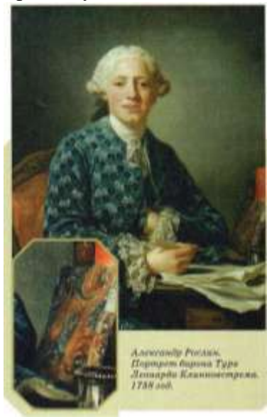
Александр Родин. Портрет сына Туре Лешира Келинестреля. 1788 год.

Современные специалисты создают новые техники и эффектные образы. Очень популярна в Турции школа мраморирования эбру (название происходит от турецкого слова ebri – «воздушные облака») – рисование на поверхности воды с последующим переносом изображения на бумагу, ткань или другую основу. Впрочем, эту технику издавна практиковали не только в Турции. В XIX веке она была известна под названием «абри» (в вольном переводе с персидского – «затуманенная бумага»), а в современном Иране именуется «абр-о-бад» – «облако и ветер». В рамках школы эбру практикуется несколько техник, в том числе авторских.