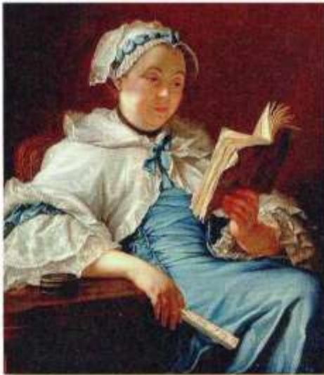
Донат Нонкотт. Портрет читающей женщины художника. Середина XVIII века.

Мраморная бумага XVIII столетия отличается широтой разводов, размахом мазка. В этот период она становится не только модным, но и экономичным (по сравнению с кожей) элементом оформления книг. Кроме книжных обложек, мраморную бумагу начинают применять в дизайне интерьеров для облицовки элементов мебели: створок шкафов, торцевых частей комодов и т. п.