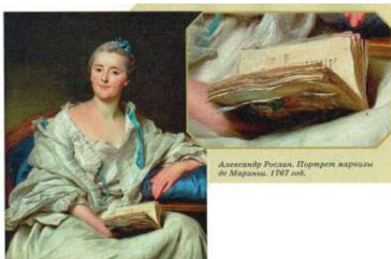
Александр Рослин. Портрет маркизы де Мариньи. 1767 год.

Ещё большую популярность марблинг приобретает в XIX веке после публикации трактата английского художника Чарлза Вулно «Искусство мраморирования» (1853 год) и открытия венгерским переплётчиком немецкого происхождения Йозефом Халфером метода длительного хранения каррагинана. Прежде шероховатая мраморная бумага в книжных переплётах приобретает гладкость, цвета становятся менее яркими, а рисунки – менее крупными.