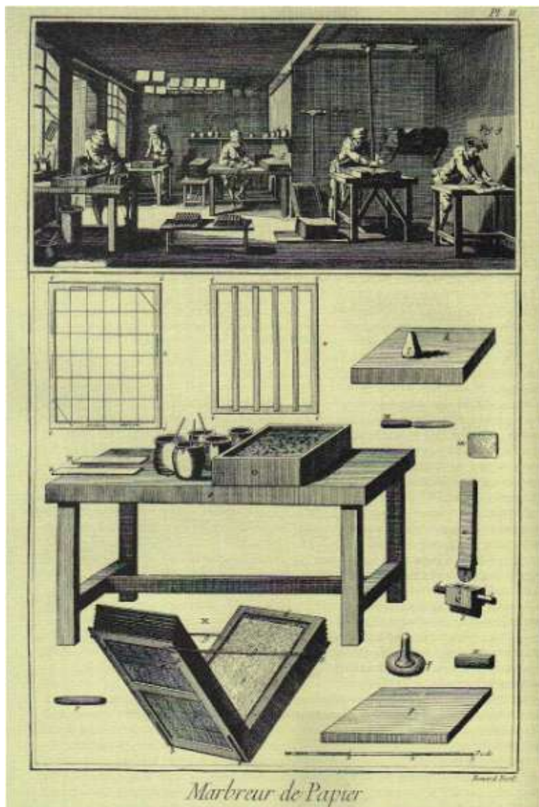
Мраморщики за работой; инструменты и приспособления для мраморирования бумаги. Гравюры из Энциклопедии Дени Дидро и Жана Лерона д'Аламбера. 1767 год.