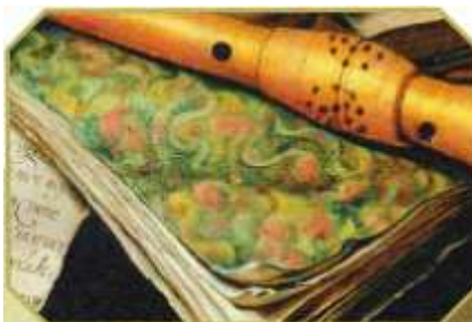
Эварт Кохлер, Натюрморт с книгами, рукописями и черепом. 1663 год.

Натюрморт-обманка , или иллюзионистский натюрморт, представляет собой картину с иллюзией трёхмерного пространства, имитирующей реальность и подлинность изображаемых предметов.