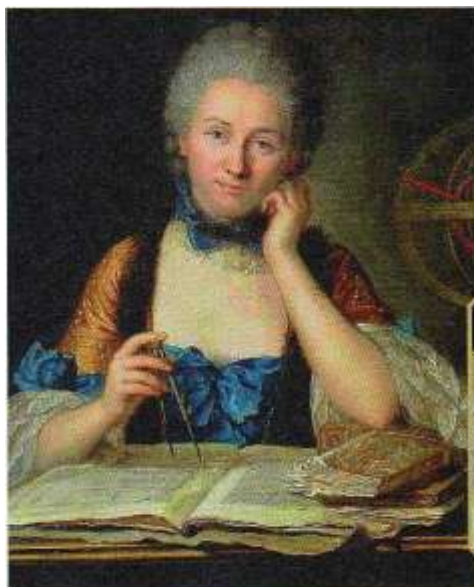
Морис Квентен де Латур. Портрет Эмили дю Шатле, одной из первых женщин-математиков. Середина XVIII века.

Мраморирование бумаги становится очень популярным. Подробный иллюстрированный рассказ о технологии этого процесса вошёл в «Энциклопедию наук, искусств и ремёсел» Дени Дидро и Жана Лерона д'Аламбера, изданную в 1767 году