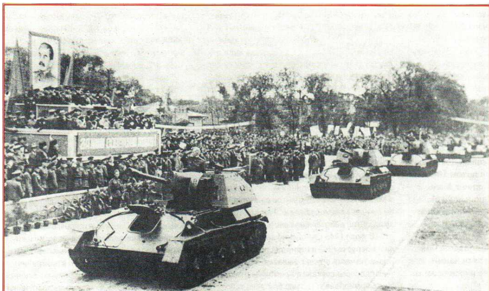
Торжественное прохождение военной техники. Харбин. 16 сентября 1945 г.

- Не надо этого делать. Мы освободили Маньчжурию, а сносить или не сносить чужие памятники - это уже не наше дело. Пусть городские власти сами решают и сами выполняют свое решение.