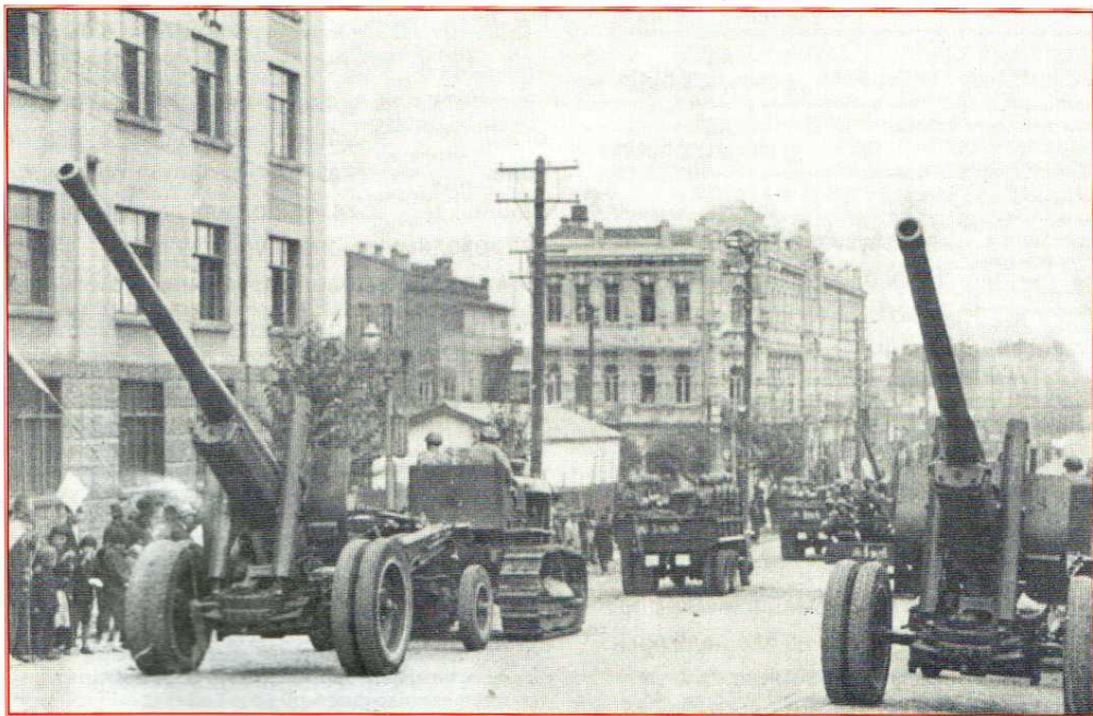
Торжественное прохождение военной техники. Харбин. 16 сентября 1945 г.

Потом пошли колонны демонстрантов. Харбин - город многонациональный. Помимо китайцев и русских в нем жили своими общинами корейцы, поляки, татары, немцы и другие народности. Все они вышли на демонстрацию в национальных одеждах, с детьми, у каждого в руках красный флажок или алая гвоздика - так что зрелище было очень красочное. Людской поток тек мимо трибуны до самых сумерек, пока не вспыхнули огни иллюминации.