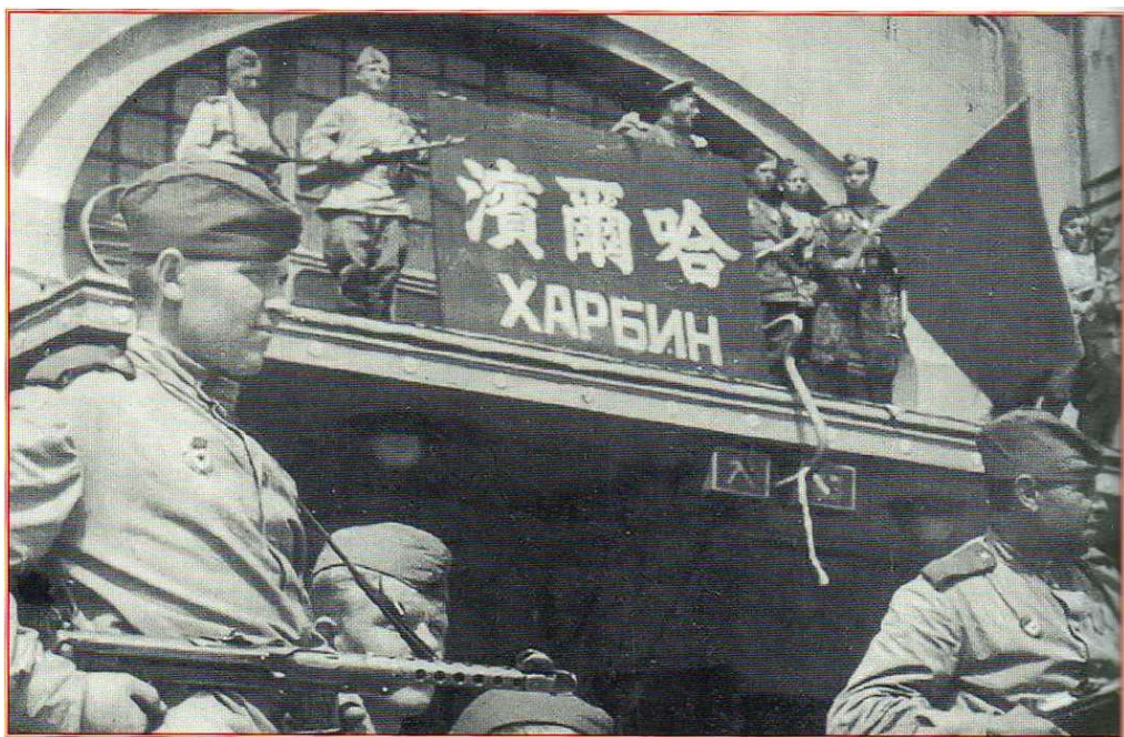
Советские воины в Харбине. Маньчжурия. Август 1945 г.

Маршал Советского Союза К.А. Мерецков и главный маршал авиации А.А. Новиков. На аэродроме прибывших встретили представители советского военного командования во главе с начальником харбинского гарнизона дважды Героем Советского Союза генерал-полковником А.П. Белобородовым... По сообщению печати тех времен, "жители Харбина горячо приветствовали славных полководцев Красной Армии". Советские военачальники осмотрели захваченную японскую технику, которая вскоре будет выставлена на набережной Москвы-реки для всеобщего обозрения.