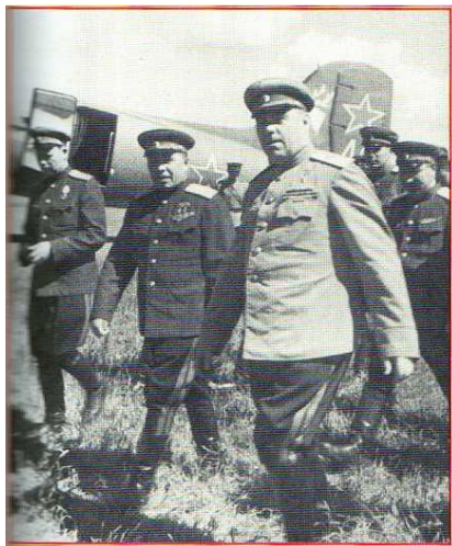
Генерал-полковник А.П. Белобородов и Маршал Советского Союза А. М. Василевский. Дальний Восток. Август 1945 г.

Маршал спросил, как мы готовимся отметить день Победы над Японией. Я доложил, что сегодня в театре "Модерн" будет большой концерт с участием местных артистов и армейского ансамбля песни и пляски, и Военный совет армии приглашает наших высоких гостей. Александр Михайлович согласился и добавил, что завтрашний день проведет с нами, а потом поедет в Порт- Артур.