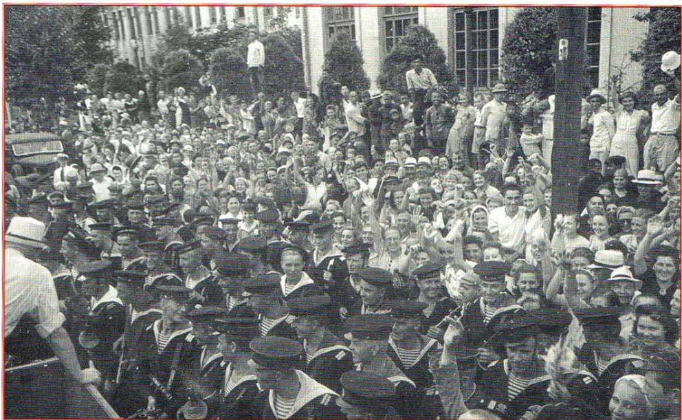
На параде советских войск в честь победы над Японией. 16 сентября 1945 г.

скажем, щегольское обмундирование. Боевую технику отремонтировали, покрыли свежей краской. Все бойцы и командиры» готовились не покладая рук.