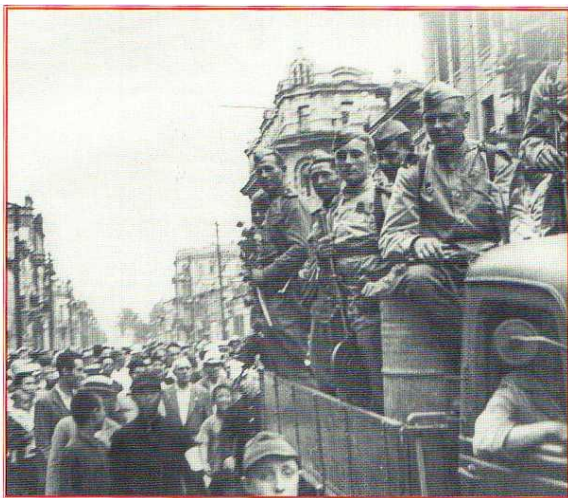
Советские войска на улицах Харбина. Маньчжурия. Август 1945 г.

Концерт ему понравился, особенно второе отделение, где выступили наши солисты, хор и танцоры. У вокалистов Харбина были хорошие голоса, они неплохо спели романсы, потом драматические