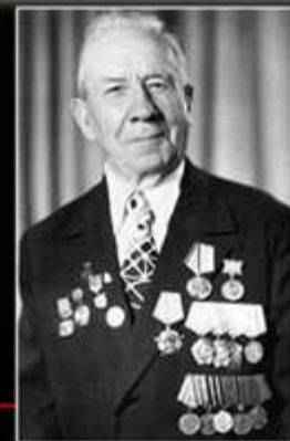
Партизанский отряд «Бати»