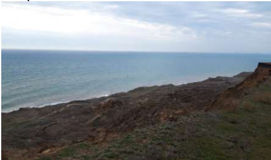
Оползень на мысе Железный рог

На южном берегу Таманского полуострова, на мысе Железный Рог сошел оползень. Причина схода - переувлажнение почвы в связи с таянием снега и обильными осадками.