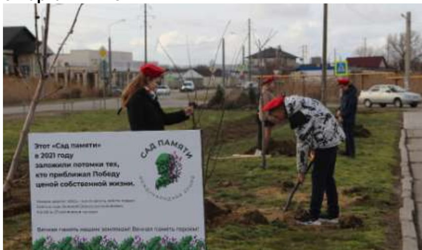
Акция «Сад памяти»

С 18 марта по 22 июня в Темрюкском районе пройдет международная акция «Сад памяти», в рамках которой будут высажены 500 саженцев деревьев.