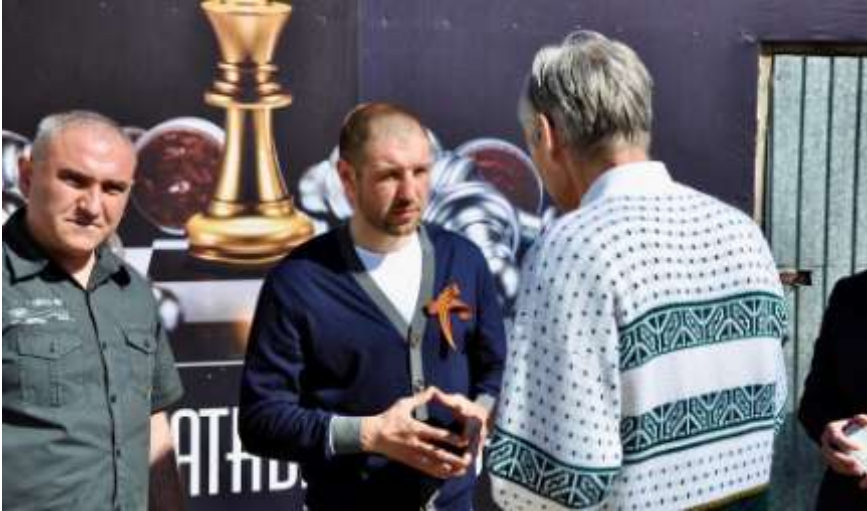
Депутат Государственной Думы РФ Дмитрий Пирог с визитом в Темрюке

Депутат Госдумы, член фракции «ЕДИНОЙ РОССИИ» и Комитета по физической культуре, спорту, туризму и делам молодежи Дмитрий Пирог провел в городе Темрюке сеанс одновременной игры с членами шахматно-досугового клуба при районном отделении Всероссийского общества инвалидов.