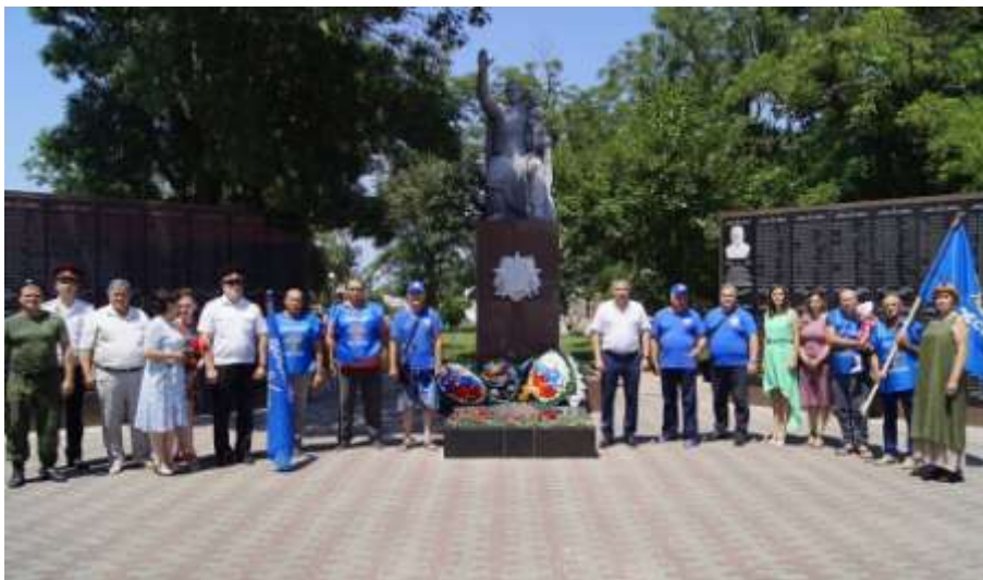
Участники международного автопробега, посвященного 76-летию Великой Победы

В Тамани у мемориала Боевой Славы прошло торжественное мероприятие в рамках международного автопробега ДОСААФ России, который посвящен 76-летию Великой Победы и 95-летию создания организации «Добровольное общество содействия армии, авиации и флоту России».