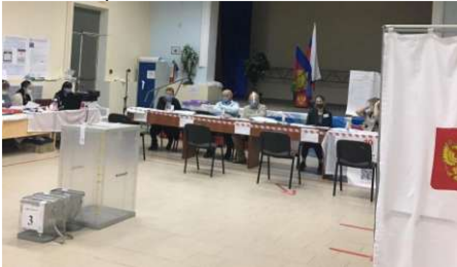
Единый день голосования

17-19 сентября 2021 года - выборы депутатов Государственной Думы Федерального Собрания Российской Федерации восьмого созыва.