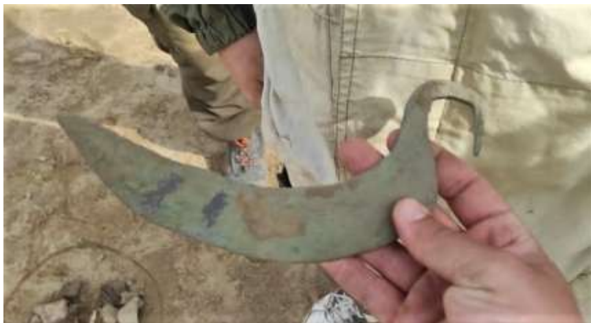
Бронзовый серп возрастом более 3,5 тысяч лет

В Темрюкском районе на месте строительства автодороги обнаружен бронзовый серп возрастом более 3,5 тысяч лет. Подобных серпов при раскопках найдено всего около полусотни. Схожие артефакты обнаружены недалеко от Анапы, в Абинском и Отрадненском районах. Они датируются примерно XV-XIII вв. до нашей эры, – отметил вице-губернатор региона Сергей Болдин.