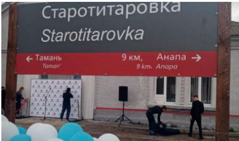
Железнодорожная станция Старотитаровская

Южная пригородная пассажирская компания открыла движение пригородных поездов РА2 с остановкой для посадки и высадки пассажиров на станции «Старотитаровская». В честь открытия первым пассажирам вручили сувениры.