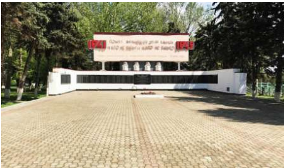
Станица Курчанская. Мемориал боевой славы

В Темрюкском районе реконструировали два воинских захоронения.