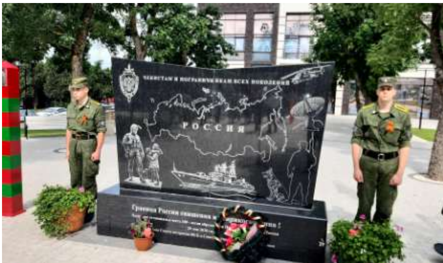
Эстафета «Знамя Победы»

Ветераны, казаки и жители Темрюкского района встретили в станице Тамань и в городе Темрюке эстафету «Знамя Победы».