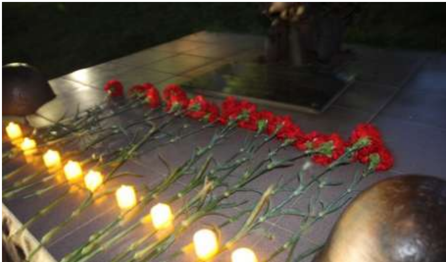
Патриотическая акция «Свеча памяти»

Город воинской доблести Темрюк присоединился к Всероссийской акции «Свеча памяти», которая стартовала в ночь с 21 на 22 июня на территории музея «Военная горка».