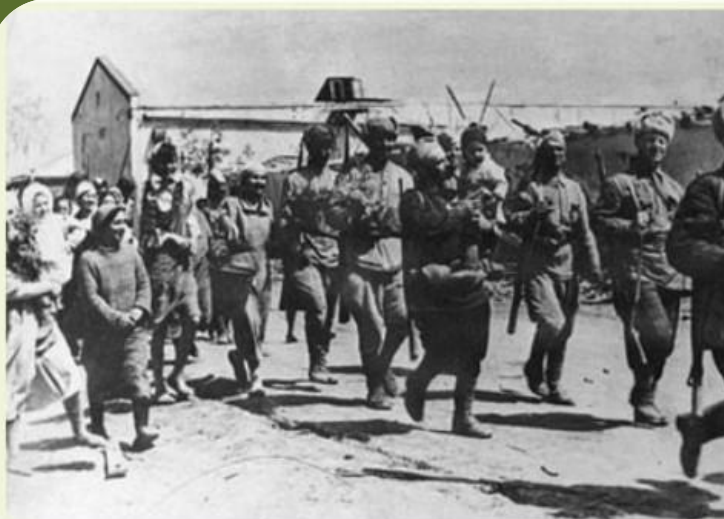
Воины-освободители проходят по улицам Крымской

Главная битва развернулась в станице Крымской, борьба за ее освобождение шла больше месяца. И вот в ночь с 4 по 5 мая 1943 года станица была освобождена. Но только спустя три месяца, 17 сентября 1943 года, после окончательного прорыва «Голубой линии», удалось полностью изгнать фашистов из Крымского района.