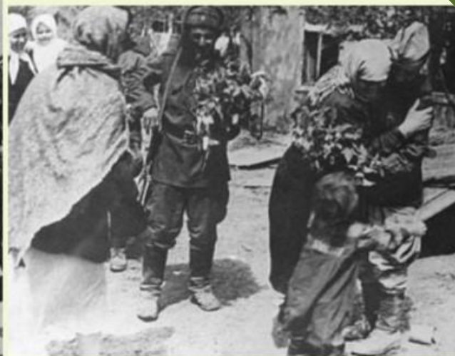
Для жителей освобожденной станицы каждый солдат был родным