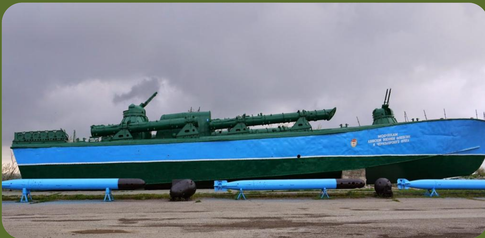
Морякам Азовской военной флотилии и Черноморского флота (музей «Военная горка» г. Темрюк